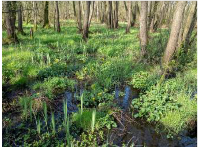
Foto, Alluviaal bos

Belangrijkste projectdoel voor de herinrichting van de Oude Strijper Aa is behoud en herstel van de voor het gebied kenmerkende natuurwaarden zoals alluviale bossen en heide. Dit willen we bereiken door het bestrijden van de verdroging van het gebied. Hiervoor willen we verschillende hydrologische herstelmaatregelen treffen. Deze maatregelen vallen grofweg in drie subdoelen uiteen, die op elkaar ingrijpen en een positieve invloed hebben op de grondwaterstanden ter plaatse van de aangewezen habitats en de aangewezen natte natuurparel.