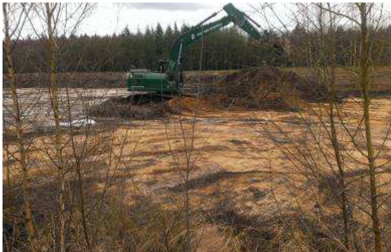
Foto, afgraven bouwvoor

Staatsbosbeheer graaft in het kader van het actieplan Leven de Dommel en opgaven vanuit het N2000-beheerplan enkele percelen af voor natuurontwikkeling op deze percelen.