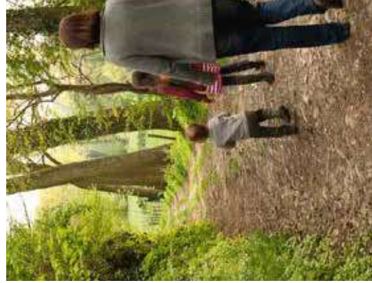
Met alle zintuigen genieten in Het Burreken.

Op zaterdag- en zondagmiddag kun je in woon- en zorgcentrum PURA terecht voor een drankje.